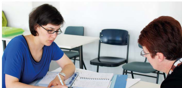
Kompetenzberatung und digitale Bewerbungsinstrumente Konzepte und Erfahrungen aus dem Modellprojekt „Credit Points“

Förderprogramm „Integration durch Qualifizierung IQ“